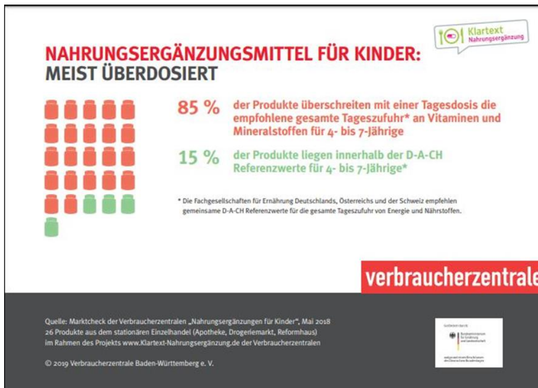
Abbildung 2 – Nahrungsergänzungsmittel für Kinder: Meist überdosiert

Tatsächlich gibt es bereits in zahlreichen EU-Staaten (wie Belgien, Frankreich, Dänemark, Italien, Irland, Luxemburg, Niederlande, Polen) sowie Norwegen und der Schweiz nationale Höchstmengenregelungen. Deutschland sollte hier nicht Schlusslicht sein.